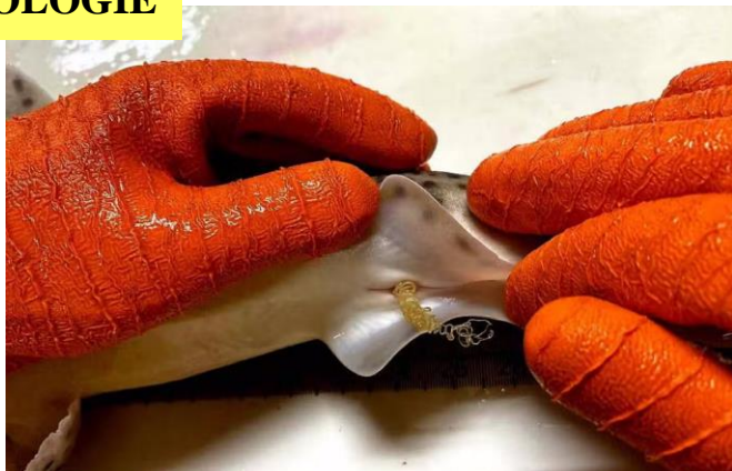
Petite Roussette avec œufs. Leelou Chouteau

Des scientifiques étudient depuis 24 ans les déplacements des requins en Manche et Mer du Nord. Ils ont constaté que 6 espèces sur 9 se sont déplacées vers des eaux plus froides. Étant des espèces clés pour le fonctionnement des écosystèmes, dangereusement vulnérables à la fois au changement climatique et à la pêche, une révision urgente des mesures de gestion actuellement en place serait nécessaire afin de préserver le fonctionnement et l'équilibre des écosystèmes.