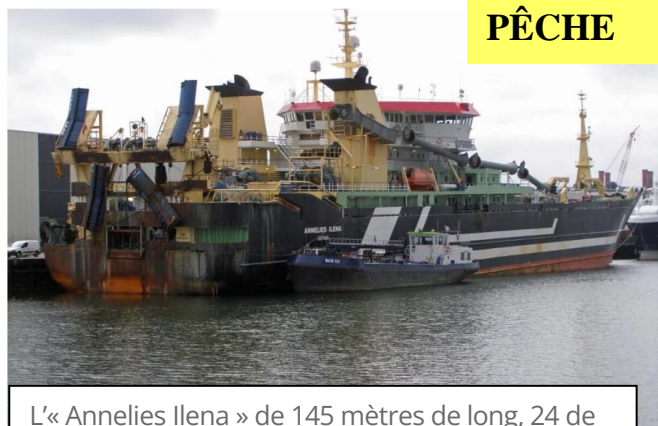
L'« Annelies Ilana » de 145 mètres de long, 24 de large, et son chalut de 600 mètres.

La Compagnie des pêches de Saint-Malo vient d'investir 15 millions d'euros dans ce chalutier si gigantesque qu'il ne peut passer le chenal de la cité corsaire.