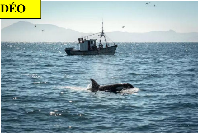
Un orque proche d'un bateau de pêche dans le détroit de Gibraltar.

De plus en plus de navigateurs, particulièrement du côté de Gibraltar, font état d'attaques d'orques contre leur voilier. Jeu, vengeance d'un clan après une collision ? Il faut aussi admettre que les nouvelles technologies permettent la communication massive de ces actes.