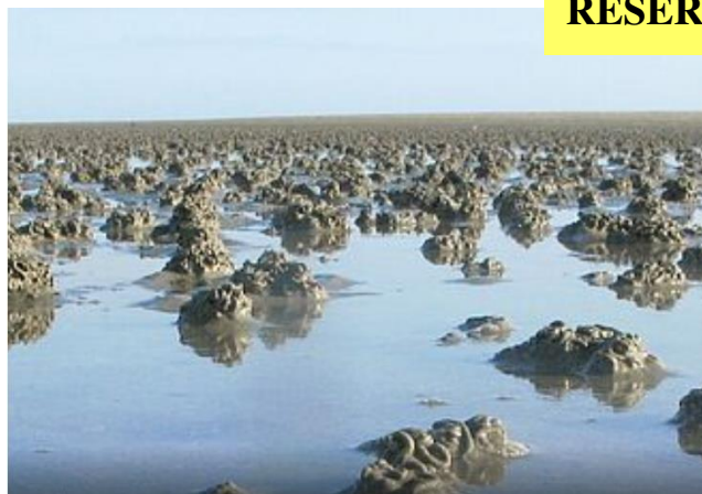
Photo : tortillons de ver Arénicole sur sable vaseux.

Ce site vous décrit les habitats, la faune, sur les domaines terrestres et maritimes. Jetez un coup d'œil à la partie sur les invertébrés benthiques qui propose des documents à télécharger sur certaines espèces.