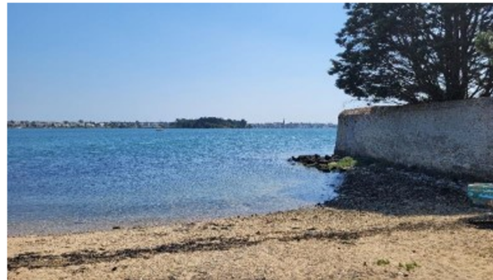
PM : courses relais