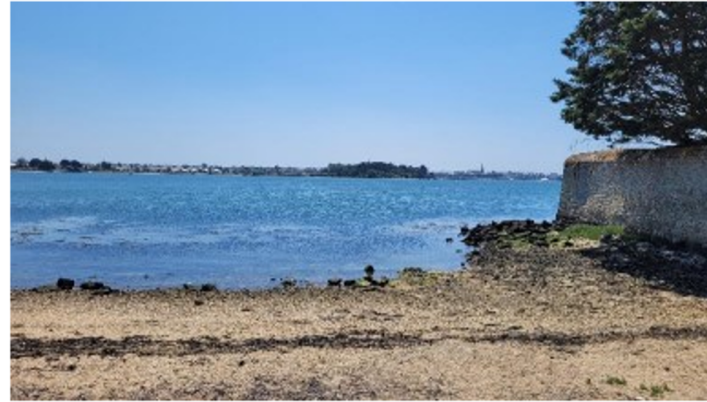
PM -1h30: course 5000m