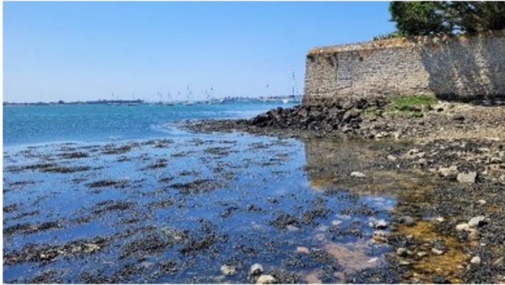
PM -2h30: course 1250m