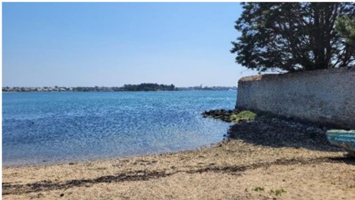
PM -0h30: course 2500m open