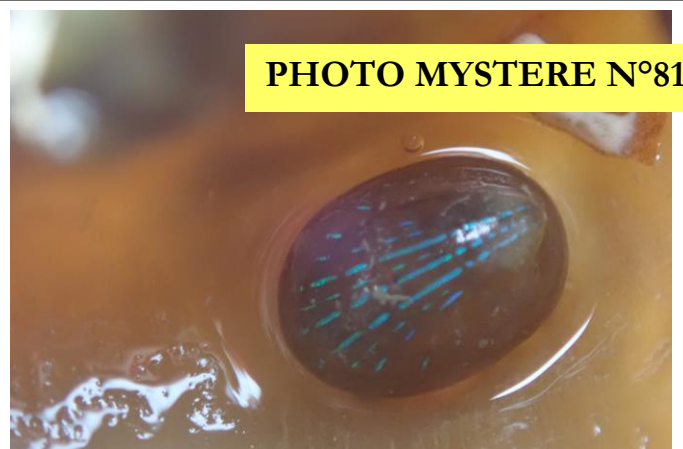
estran du Croisic, 20/03/2022