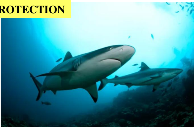
Les requins sont-ils menacés ?

Les requins sont parmi les animaux marins les plus menacés. Ils sont notamment les victimes accidentelles de la pêche au large, qui décime certaines espèces comme le requin tigre, le mako, le requin bleu etc. De nouveaux travaux confirment à quel point les navires de pêche sont une menace pour ces espèces. Comme cette étude de Fisheries Research montre que 40% des requins tigre suivis par une équipe de recherche possèdent entre 1 et 7 hameçons accrochés à la gueule, un signe qu'ils ont été au contact d'un navire de pêche. Plus d'infos.