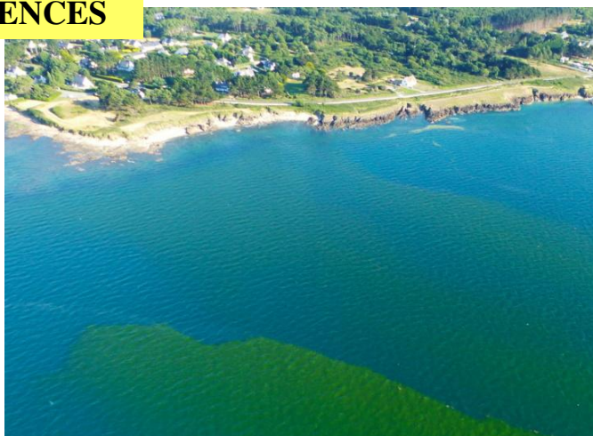
Bloom sur la côte de Loire-Atlantique

Les microalgues (ou phytoplancton) produisent la moitié de l'oxygène que nous respirons. Elles constituent la base de la chaîne alimentaire des océans. Mais certaines espèces sont toxiques. Au printemps ou en été, elles peuvent proliférer sous forme de « blooms » conduisant à l'interdiction de la consommation des coquillages.