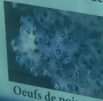
Oeufs de poissons