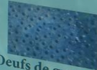
Oeufs de grenouille