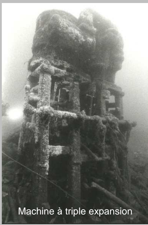
Machine à triple expansion

Bateau des grands lacs américains 1890 - 1910