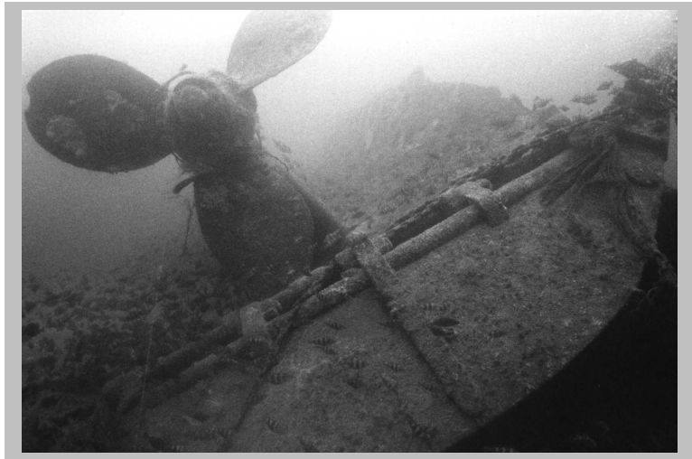
L'hélice bâbord et le safran